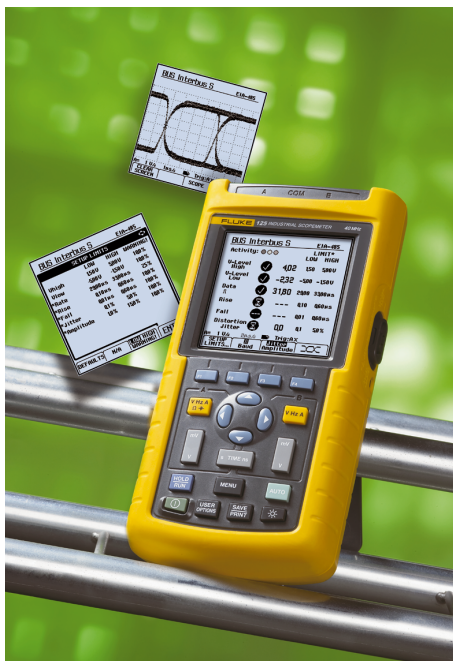
Рис. 1. Осциллограф-мультиметр Fluke 125 ScopeMeter®

Woonstede владеет, управляет и обслуживает более 10000 объектов собственности в городе Эде и вокруг него. Наряду с обычными жилыми зданиями